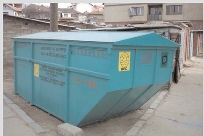
Prvi kontejneri na Kosovu za sakupljanje papira

Kad bi bilo vise ovih kontejnera, i svesnosti povezanosti javnosti sa separacijom otpada moze biti veci ukupan obim znatnog smanjenja komunalnog otpada. To je ono za sta se Eco-Trepca zalaze! Papirni otpad iz Mitrovice se transportuje u Novi Pazar (Srbija) gde ce ga upotrbiti fabrika papirnih pakovanja.