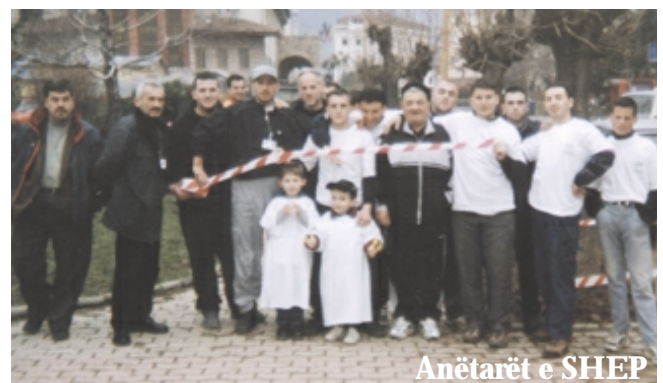
Anëtarët e SHEP

mën e organizatave: CDF, REC, USAID, IRC, GER, Departamenti për Urbanizëm dhe Mbrojtje të Mjedisit i komunës së Pejës si dhe organizata të tjera.