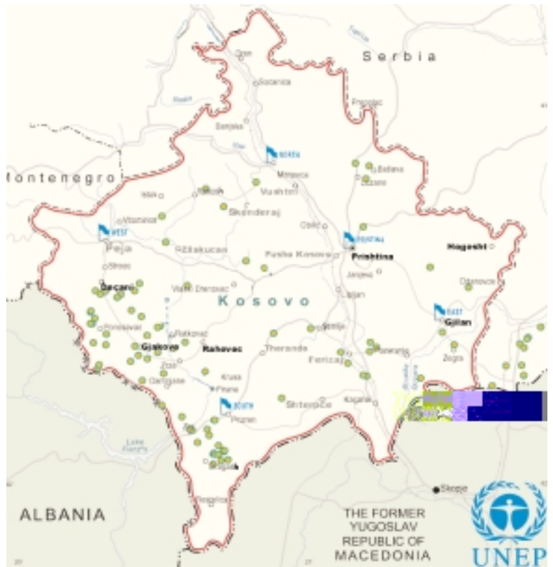
● Pozicionet e indentifikuar si caqe të qëlluara me projektile që përmbajnë DU, gjatë konfliktit në Kosovë, në 1999

mund të depozitohen në mushkëri dhe të emitojnë rrezatim. Natyrisht që pluhuri bie poshtë në tokë shpejtë dhe shumica e kontaminimit do të qëndrojë në diametrim prej 100 metrave nga caku. Shumica e projektileve nuk e godasin cakun dhe nëse toka është e butë ato do të "varrosen" në tokë. Raporti i UNEP-it nënvizon dy mënyrat kryesore në të cilat DU mund të paraqes rrezik të konsiderueshëm për shëndetin. E para është se në vendet të goditura me DU artileri