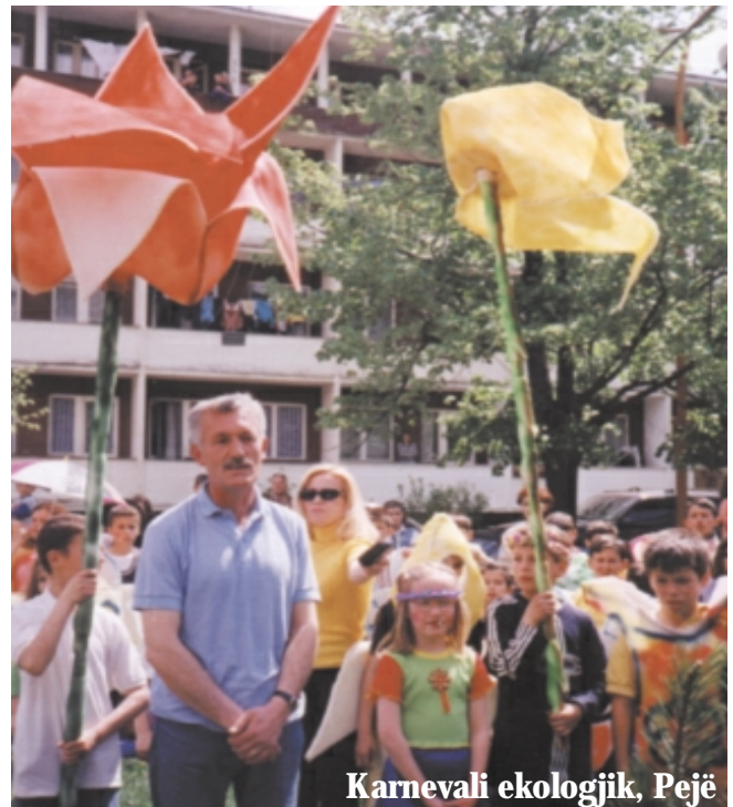
Karnevali ekologjik, Pejë

Realizimi i gjitha këtyre projekteve, ata e bën me ndih-